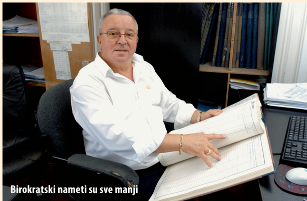
Birokratski nameti su sve manji

Od trenutka kada se započelo s procesom preupisa stranih plovila u Hrvatski registar jahti i Očevidnik brodica s privilegiranim porezom od pet posto, stalno pristižu vijesti o promjenama o kojima su hrvatski nautičari dosad mogli samo sanjati. Posljednja u nizu mjera koja bi trebala privući strane brodovlasnike je ukidanje naknade za predbilježbu i smanjenje naknada za upis brodova, jahti i brodica u upisnike i očevidnike. U pojedinim slučajevima se naime događalo da su ta dva nameta znala biti viša od razrezanog poreza. Primjera radi, za jahtu dužu od 15 metara sagrađenu izvan EU je trebalo platiti 50 tisuća kuna naknade za upis i 15 tisuća naknade za predbi-